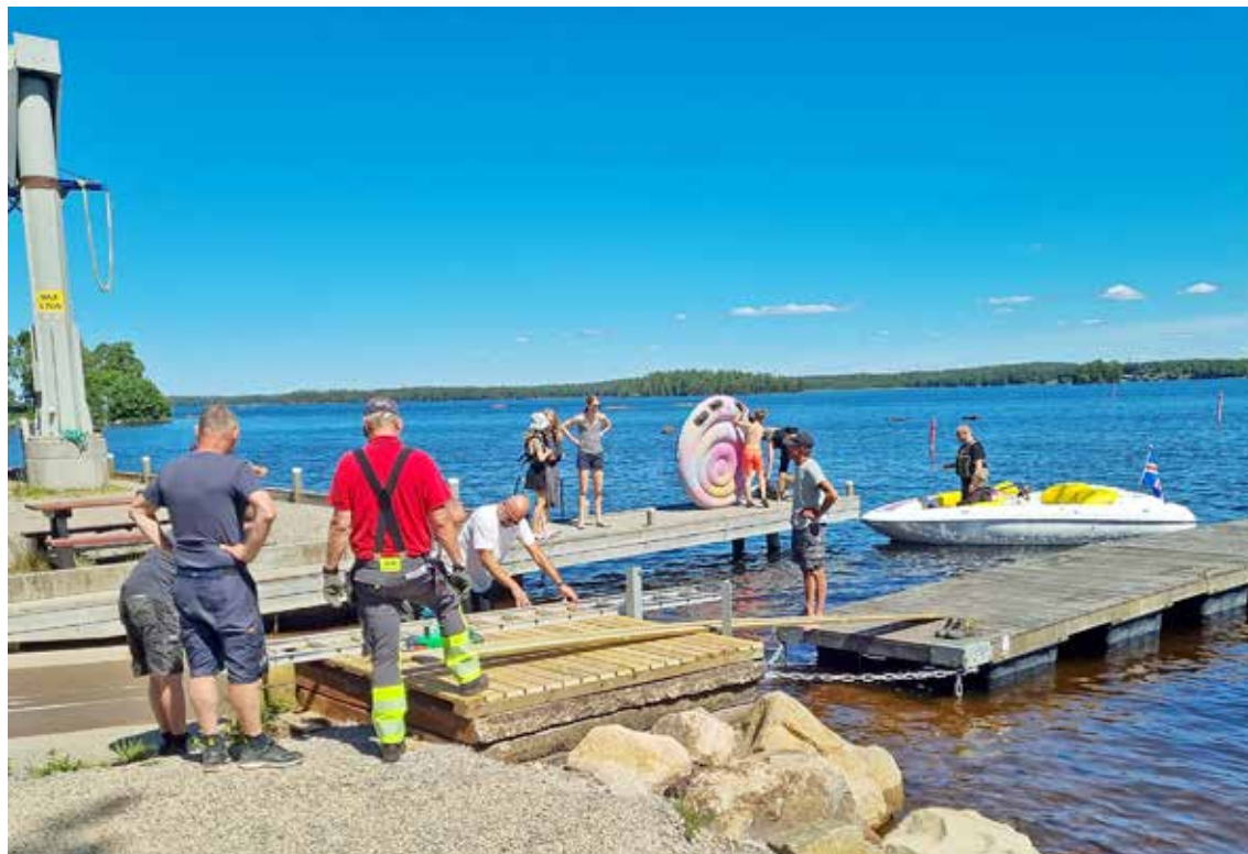
Arbetet är i full gång med den nya bryggan vid rampen på varvet.