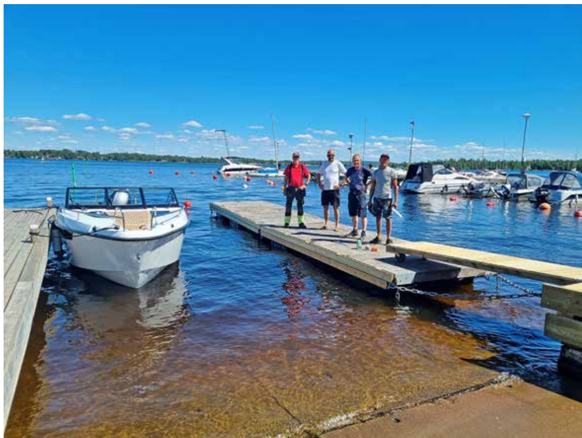
Här är delar av det glada gäng som har fixat den nya bryggan. Mer bilder kommer i nästa nummer av UfH.