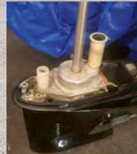
Bälgbyte Volvo Penta sx Impellerbyte

Ring Magnus 0470-653 33 eller Jeppa 076-30 83 540 för mer information och bokning av tid