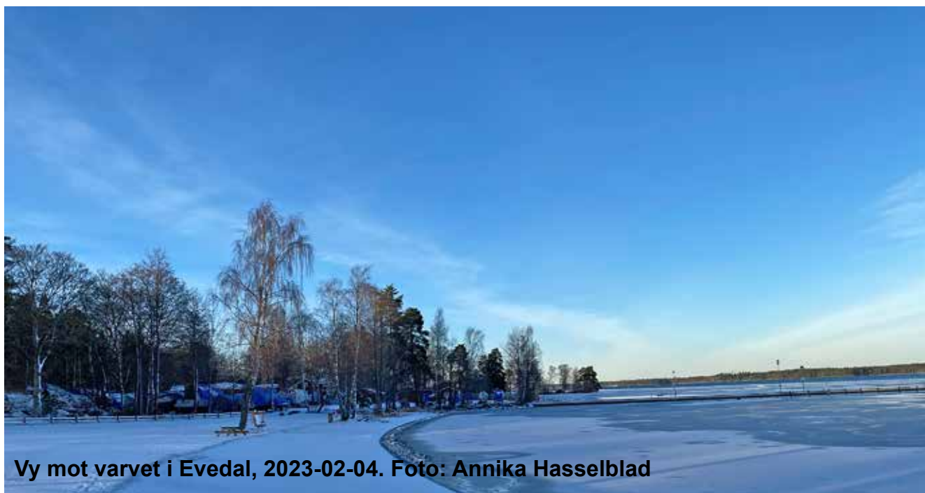
Vy mot varvet i Evedal, 2023-02-04.