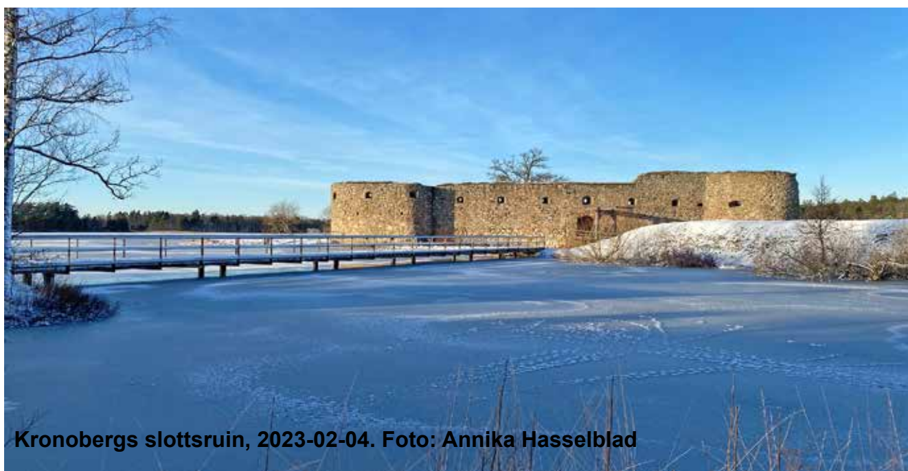
Kronobergs slottsruin, 2023-02-04.

15 mars Uppstartsmöte Segelbåtssektionen Sidan 6