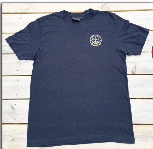
T-shirt Kings 106 Marin med screentryck