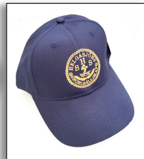
Keps HSS en storlek med brodyr i guld

Storlekar: XXL XL L M Tänk på att storlekarna kan var lite små