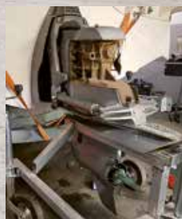
Bälgbyte Volvo Penta sx

Sandsbro Servicehall är inte bara en bilverkstad utan erbjuder också service för din båt, ditt släp och båtmotor. Vi har en mångårig erfarenhet inom båtar och motorer. Vi byter olja, filter och mycket mer enligt dina önskemål. Nu är det hög tid att tänka på service för din motor inför sommaren.