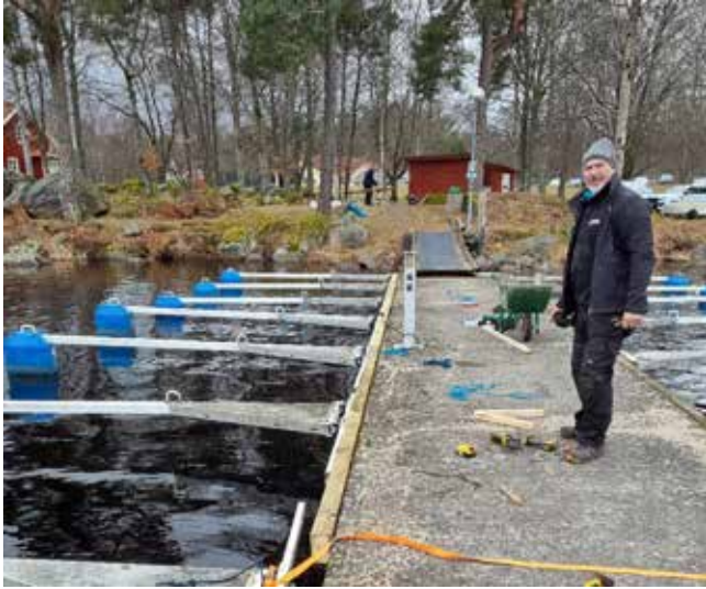
Henrik jobbar på med bytet av Mittbryggans fenderbalk.