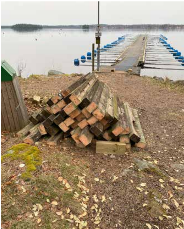
Rester av den gamla fenderbalken.