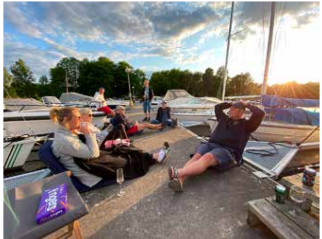
Brygghäng i Evedal, 2023-06-03