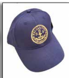
Keps HSS en storlek med brodyr i guld