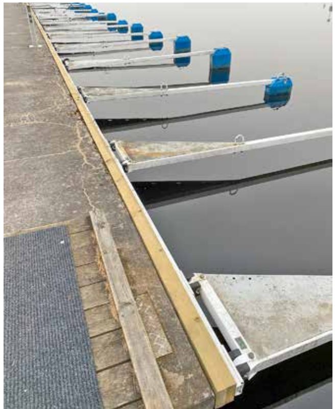
Snart har hela bryggan fått nytt virke.